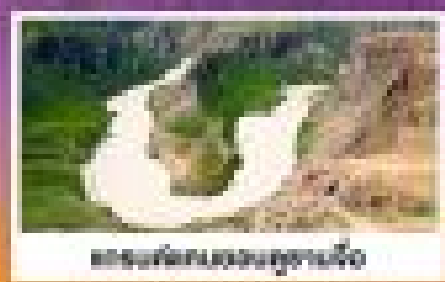
ถนนหินขาวบนทุ่งหญ้า