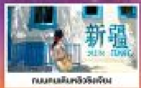
ถนนหินสีบริเวณสีฟ้า