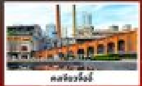
ศาลเจ้าหวู่เจี๋ย