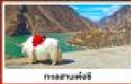
ทะเลสาบเฉิงไห่