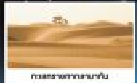
ทะเลทรายทัตเตอร์กัน