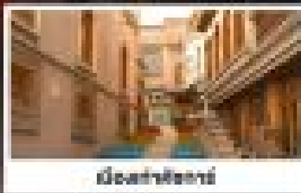
เมืองเก่าคิงคาร์ท