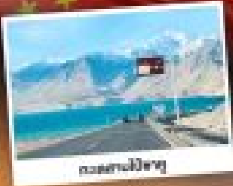
ทะเลทรายโกบี

ซินเจียงใต้ สุดขอบแห่งทะเลทราย สัมผัสวัฒนธรรมของชาวซินเจียงยุคเก่า