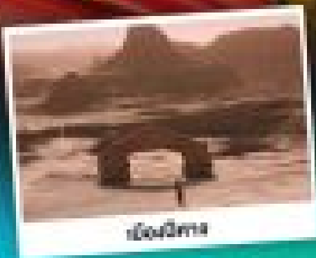
เมืองอูรุมชี