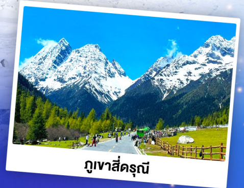
กุเวาสีดรุณี