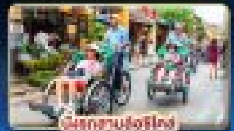
จักรยานไฟฟ้า