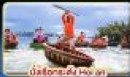
เทศกาลแข่งเรือ