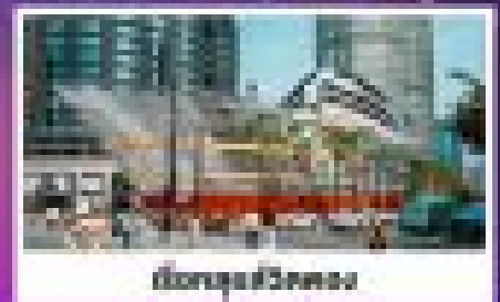
เดินช้อปปิ้งหรู