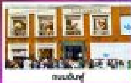
โรงแรมหรู