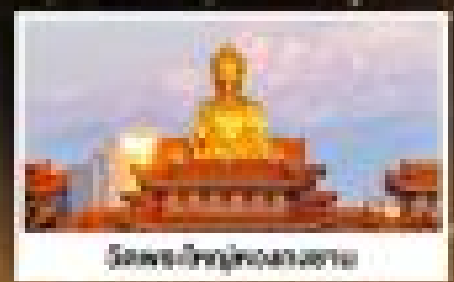
วัดพระใหญ่เทียนชาน