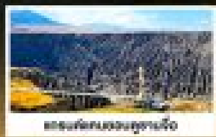
ทะเลสาบสีเทอร์ควอยซ์