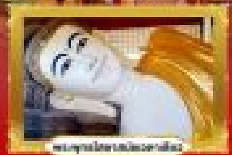
พิกุลอินทรีทองอินทรีทอง