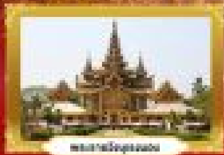
พิกุลทองอินทรีทอง

ย่างกุ้ง • ทนสาวคี • อินทรีทอง | 3 วัน 2 คืน