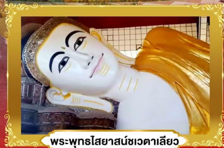
พระพุทธรูปไสยาสน์ชเวตาเลีย