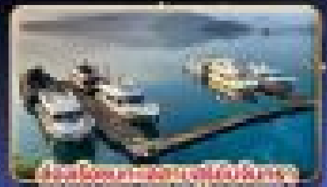
วิวทะเลสาบสวย