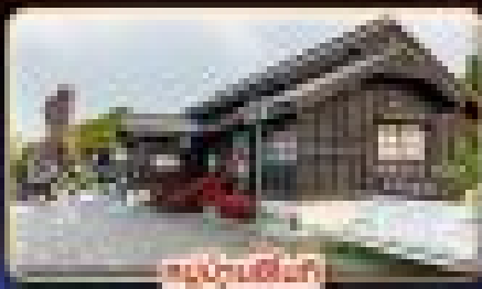
ที่พักหรู

"ไทป์" มหานครแห่งเมืองสี่พัน เที่ยวชิว เช็กอินจุดไฮไลท์