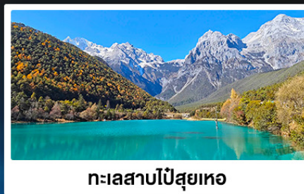
ทะเลสาบโป๋ส่วยเหอ