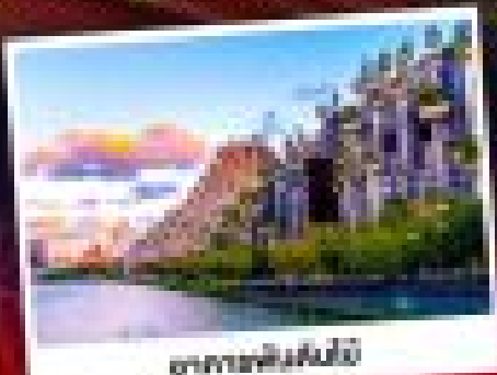
สวนสนุกดิสนีย์