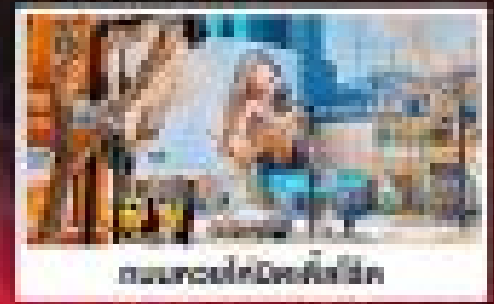
สวนสนุกดิสนีย์