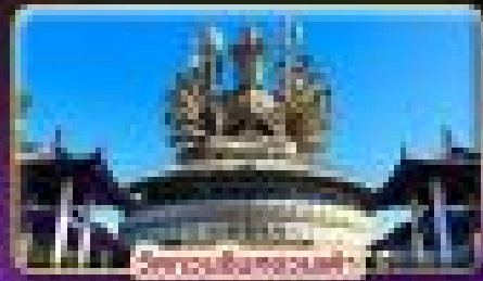
วัดเจียงอัน