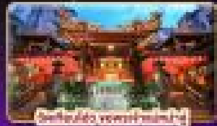
วัดเจียงอัน