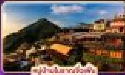
อุทยานแห่งชาติไถ่

ฮ็องคิงฮุ่ ฟักโกเป 2 คืน มหานครแห่งเมืองสี่พันแฉ่งไทเป