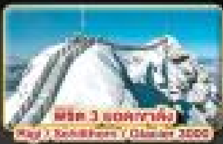
พีค 3 ยอดหิมะ Rigi / Rothhorn / Glacier 3000