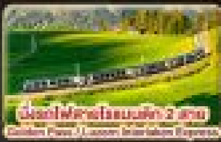
เมืองโลซานและมอร์น 2 คืน Golden Pass Panoramic International Express