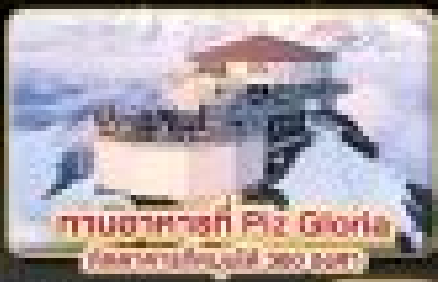
ทิวทัศน์ที่ Piz Gloria (สามารถจองได้ 50,000.-)