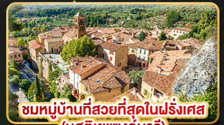
ชมหมู่บ้านที่สวยงามที่สุดในฝรั่งเศส (มูสติยาแซงท์มารี)