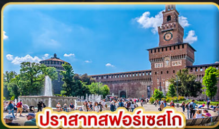
ปราสาทฟอโรเซสโก

📅 เดินทาง : 28 พ.ค.-06 มิ.ย. | 05-14 ส.ค. 10-19 ก.ย. | 15-24 ต.ค. 69