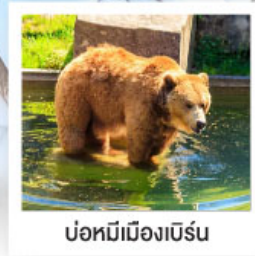
บ่อหมีเมืองเบิร์น