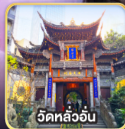
วัดหลัวอัน