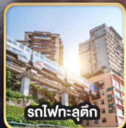
รถไฟฟ้าสุดคึก