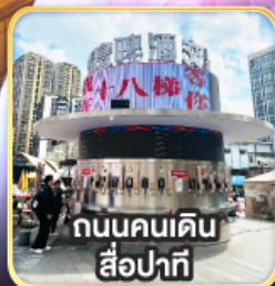
ถนนคนเดิน สี่ป่าทิ