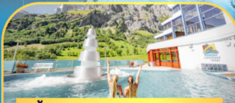
แช่น้ำแร่ร้อนผ่อนคลายลวยคอร์บิต