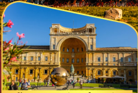
เข้าชมพีพีรภัณฑวาทักัน