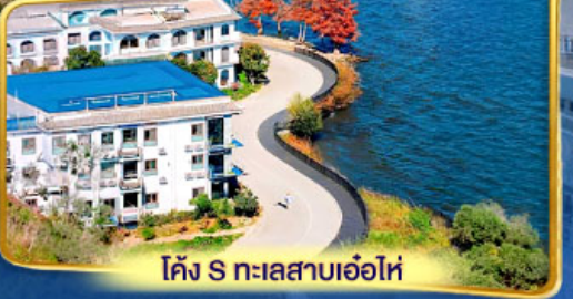
โค้ง S ทะเลสาบเอ๋อไห่