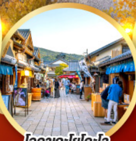
โคมะคะโยโคะโจ