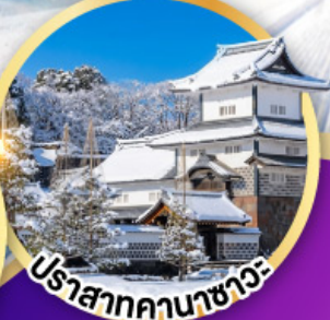
ปราสาทคานาซาวะ