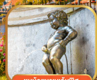
หนูน้อยมานเกินพิส