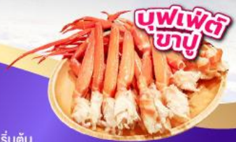
บุฟเฟ่ต์ ซาบู