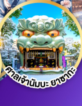
ศาลเจ้าอิมบะ ยาชากะ