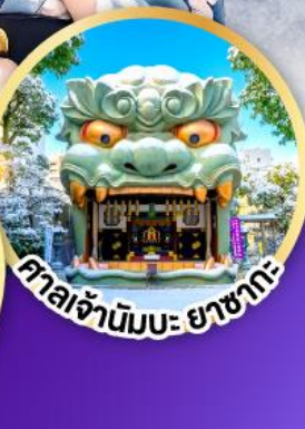
ศาลเจ้าฮิมะ ยาชากะ