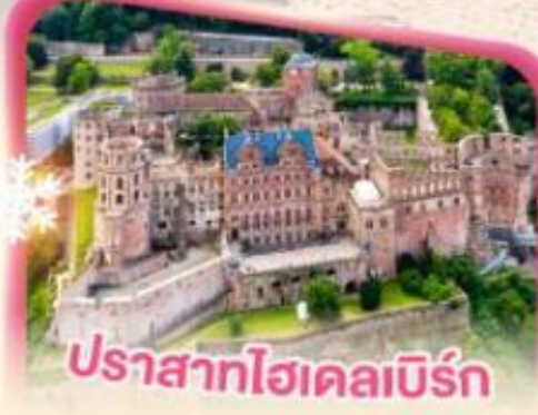
ปราสาทไฮเคลเบิร์ก