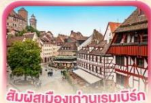
สี่มผัสเมืองเก่าบูเรมเบิร์ก