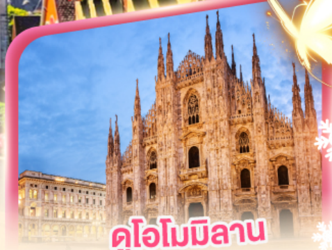
ดูโอโมมิลาน