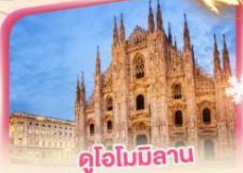
คูโอโมมิลาน