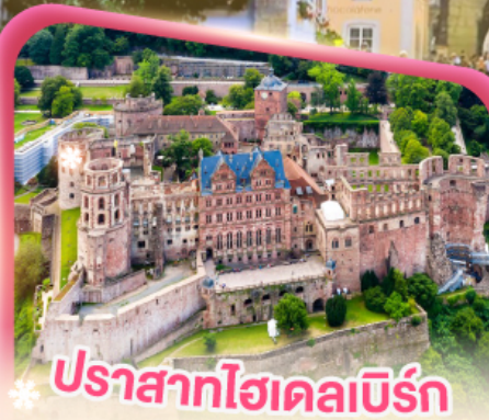
ปราสาทโฮเดลเบิร์ก