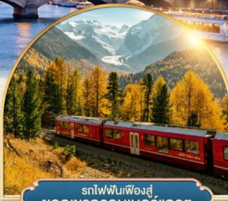
รถไฟฟันเฟืองสู่ ยอดเขากรอนเนอร์เกรต