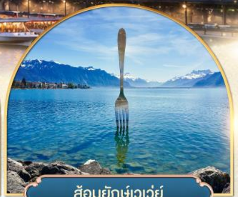
ล้อมยักเขาวัว