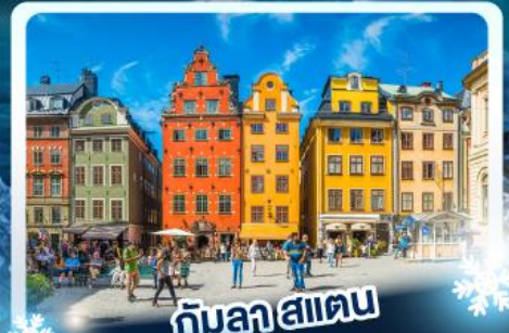
กับลาฮาลเตน