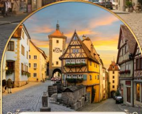
เฟลลินไลน์