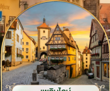
เวลินไลน์