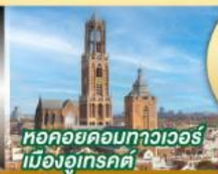
หอคอยคอกทาวเวอร์ เมืองอูเทรคต์