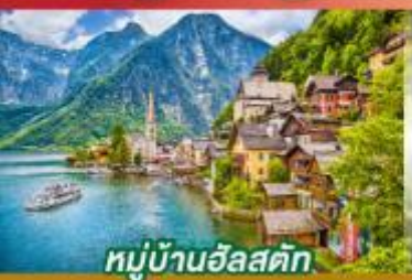
หมู่บ้านอัลสติก