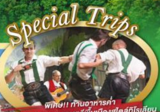
พิเศษ!! ทำอาหารค่ำ พร้อมชมการแสดงดนตรีพื้นเมืองสไตล์โรสเลียน และเขื่อนเมืองอูเทรคต์ สีสันใหม่เนเธอร์แลนด์