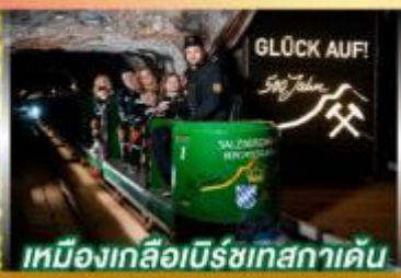
เหมืองเกลือเบียร์ชเทสกาเดิน