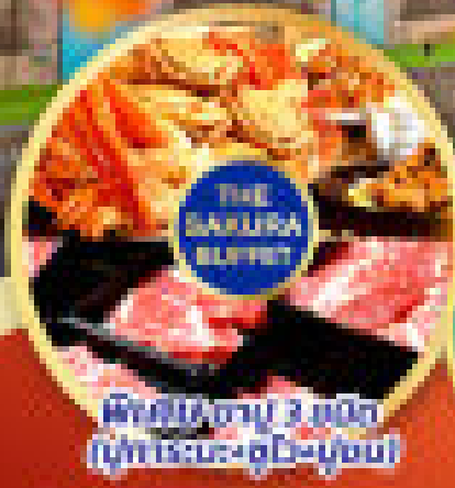
เพลิดเพลินกับ 3 มื้อพิเศษ บุฟเฟ่ต์ระดับพรีเมียม