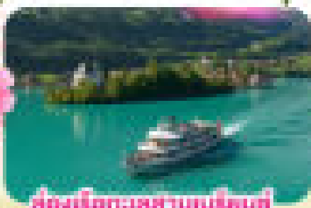
ส่องทะเลสาบลูเซิร์น

พิชิตยอดเขาขุนเมกกา 1 ในท่าที่สวยงามที่สุดเมืองออร์แมก