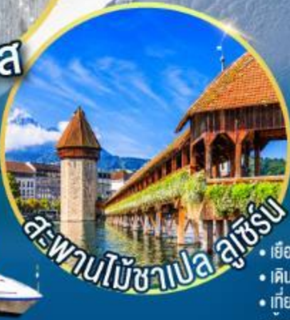
สะพานไม้ชาเปล ลูเซิร์น