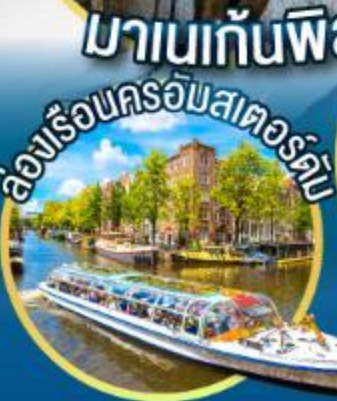
ล่องเรือชมสตอร์คัม