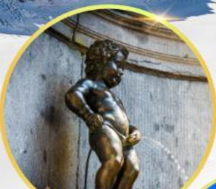
บานกันพิส