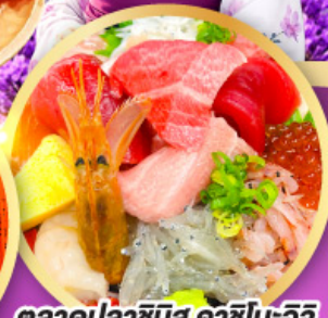
ตลาดปลาฮิมิสึ คาชิโนะอิชิ