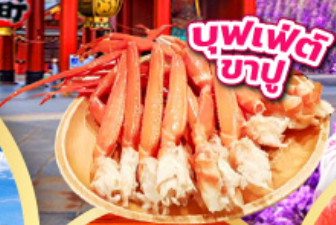
บุฟเฟ่ต์ ซาซึ