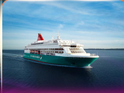
เรือสำราญ GO NORDIC CRUISE LINE