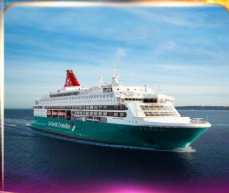
เรือสำราญ GO NORDIC CRUISE LINE