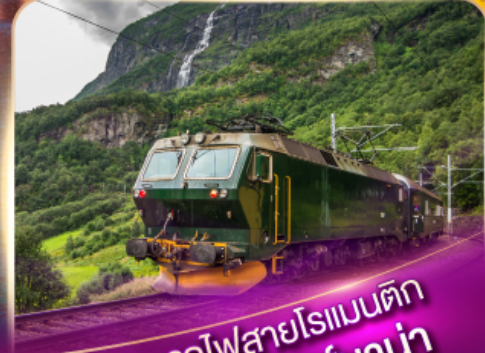
รถไฟสายโรเมนติก ฟลัมส์บาน่า