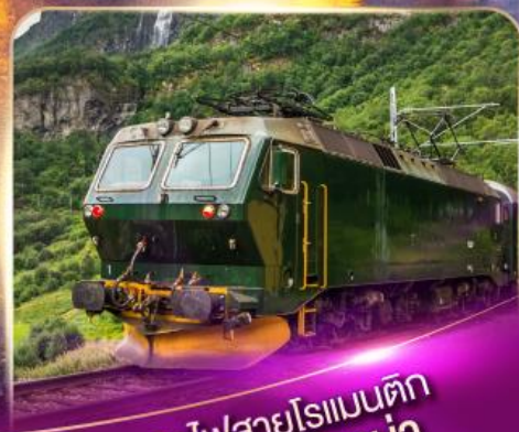
รถไฟสายโรเมนติก ฟลินส์บาน่า