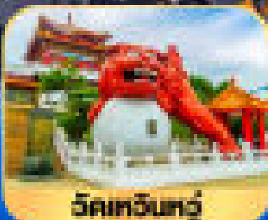
วัดเจินทง