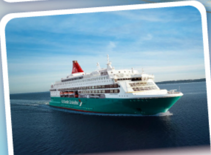
เรือสำราญ GO Nordic Cruise Line