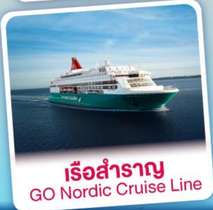
เรือสำราญ GO Nordic Cruise Line