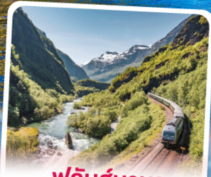
ฟลัมส์บานา รถไฟเส้นทางสายโรแมนติก