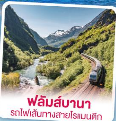
พหลิมส์บานา รถไฟฟ้าเส้นทางสายโรแมนติก