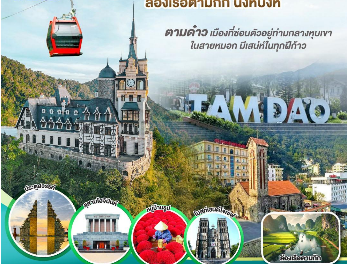
ประตูลี้สวรรค์

ตามด้าว เมืองที่ซ่อนตัวอยู่ท่ามกลางหุบเขา ในสายหมอก มีเสน่ห์ในทุกฝีก้าว