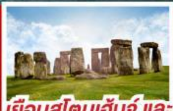
เยือนสโตนเฮ็นจ์ และ พิพิธภัณฑ์โรมันบาร