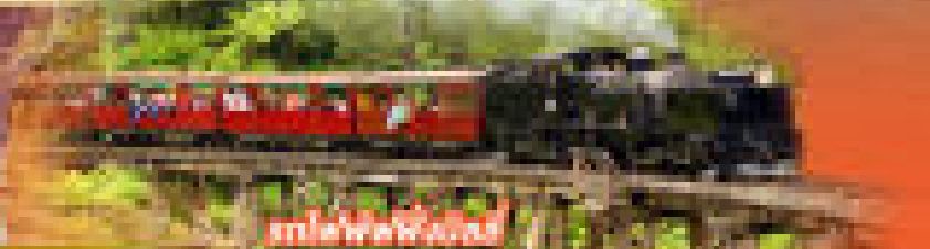
รถไฟชั่งล่น