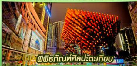
พีพีร์กทศิลป์-ตะเกียบ