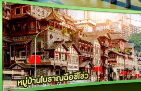
หมู่บ้านโบราณฉือฮิว