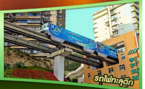
รถไฟฟ้าลัดคิว