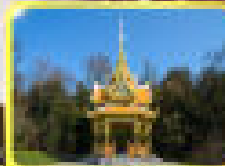
ศาลเจ้าโพธิ์ทอง