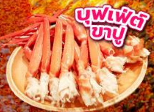
บุฟเฟ่ต์ ซาซึ

ชมใบไม้เปลี่ยนสี อุโมงค์ใบเมเปิ้ล โมมิจิโคโร