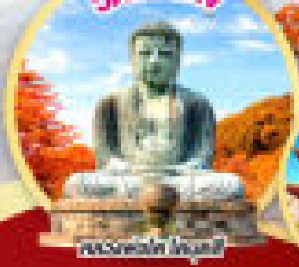
พระพุทธรูปใหญ่