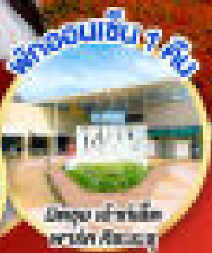
เมืองชิโยดะ สถานีชิโยดะ