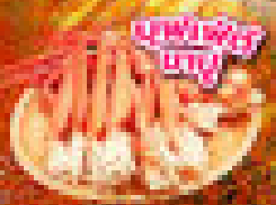
บุฟเฟ่ต์ อาหาร