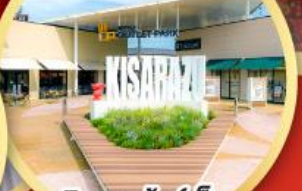
มิตซึย เอ้าท์เล็ต พาร์ค คิชะระชู