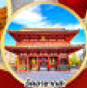
วัดชิโยดะ