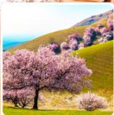
ทุ่งดอกอัลมอนด์