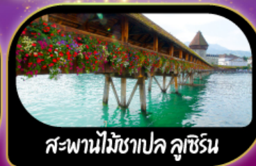
สะพานไม้ซาปค ลูซิริน