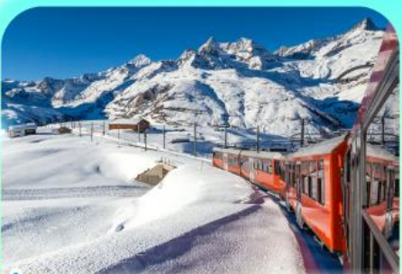
นั่งรถไฟสู่ยอดเขารอนเนอร์เกรต

สวยสะท้านฟ้าที่สวิสฯ สะกดรักที่โดมโบ พิชิตเขาแมททอร์ฮอร์นและจุงเฟรา