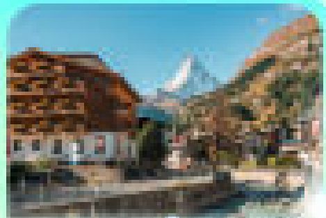
ทอริชอร์มอล