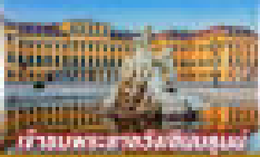
ห้างนระทงอวสขนสนน