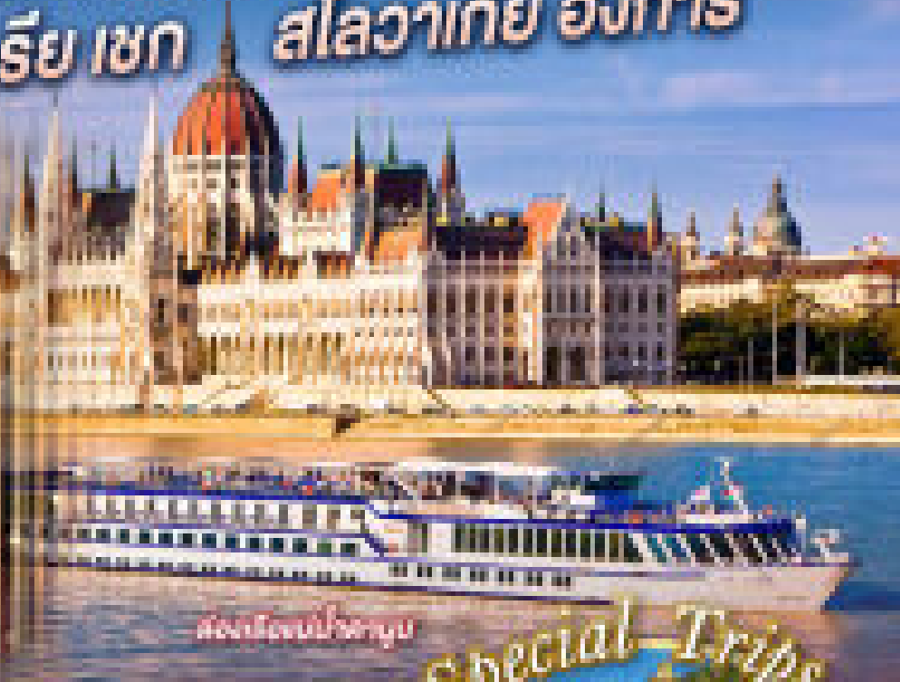
สงคโงนน้ำพำทงน