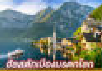
ดีงสฟัวปองนระทโท