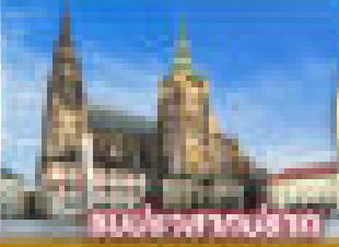
นงอ่าสางบ่งาก