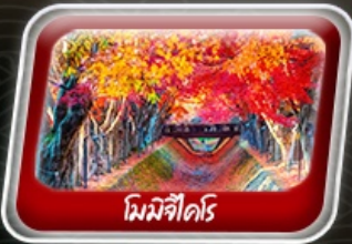
โมมิจิไดริ

✈️ สายการบิน AirAsia X (XJ) ..... น้ำหนักกระเป๋า 20 KG