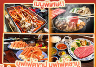
บุฟเฟ่ต์ญี่ปุ่นบุฟเฟ่ต์ญี่ปุ่น ปิ้งย่างยากิnikuในอน Steakland Kobe