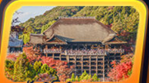
วัดคิโยมิสึเดระ