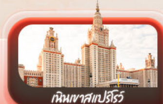
หิมเขาสเปร์ไรซ์